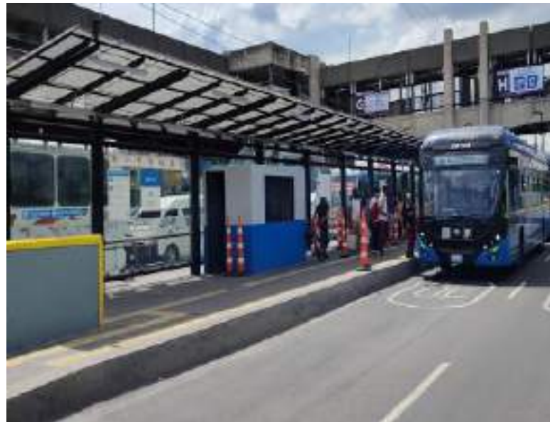
Andén H (Trolebús)