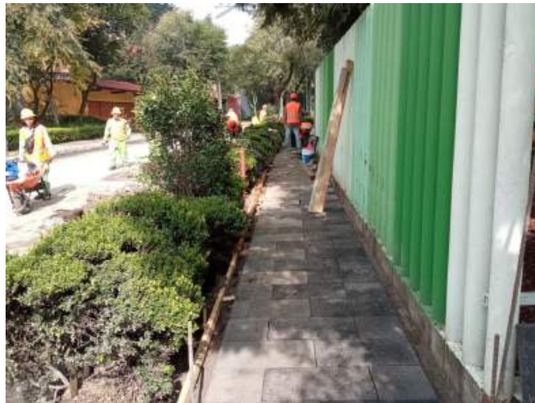
Reconstrucción de banquetas y guarniciones