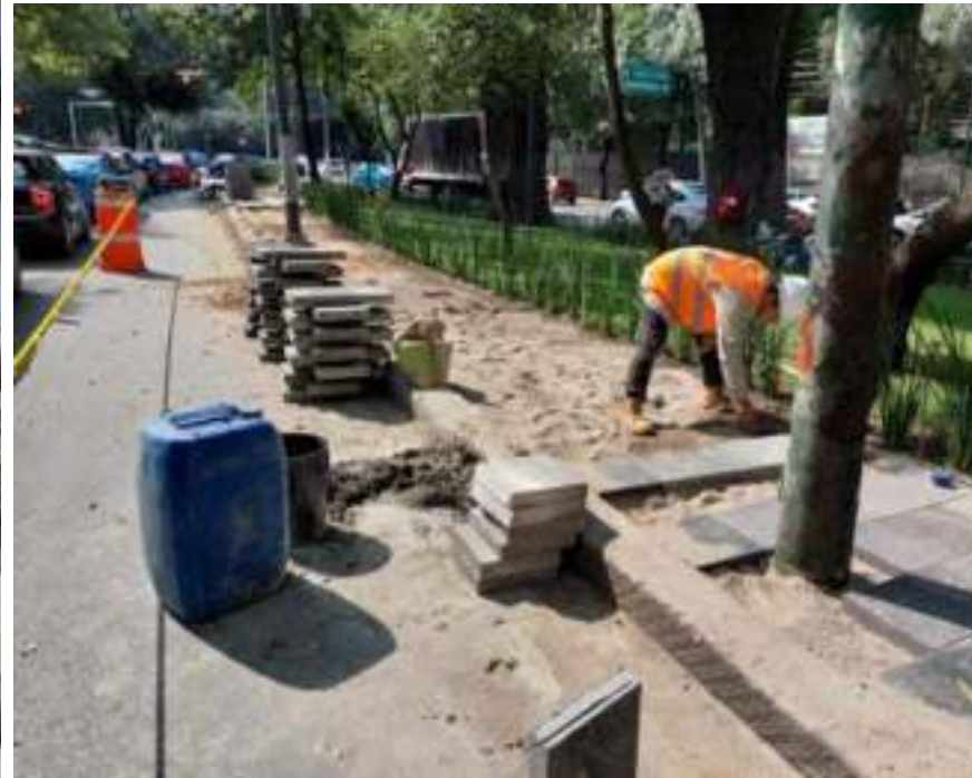
Reconstrucción de banquetas y guarniciones