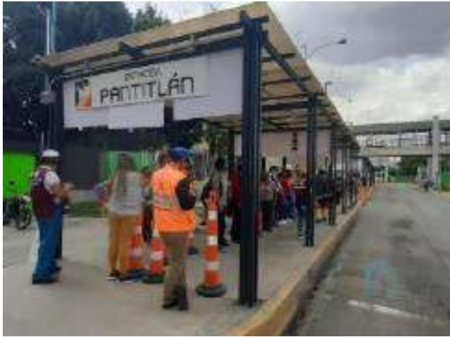
Andén A (Servicio de apoyo RTP)