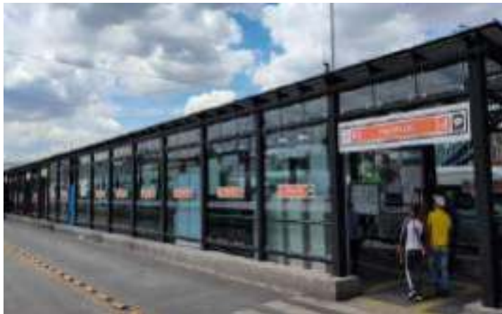
Andén O (Metrobús L4)

Talleres Gráficos (Servicio de apoyo RTP)