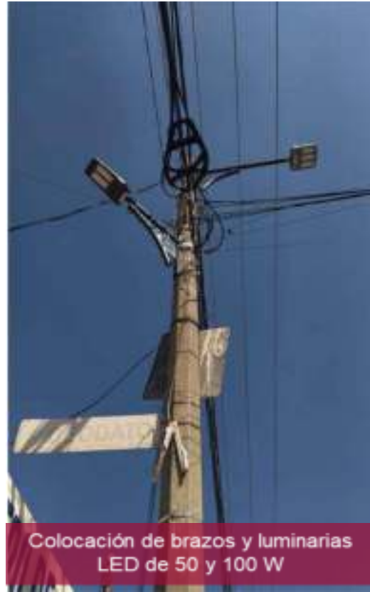
Colocación de brazos y luminarias LED de 50 y 100 W