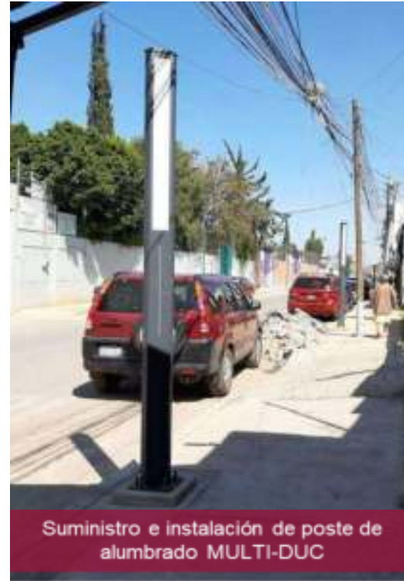
Suministro e instalación de poste de alumbrado MULTI-DUC