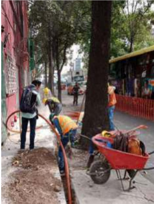
Trabajos para colocación de Luminarias