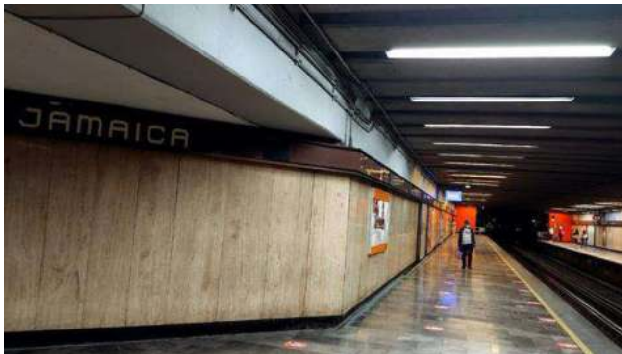
Mantenimiento de luminarias al interior de las instalaciones del metro